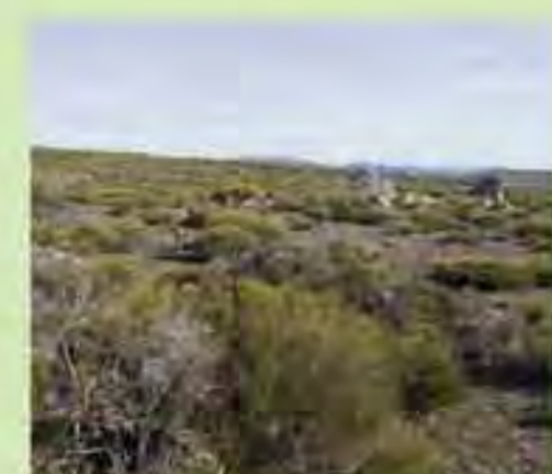
Vegetación característica de las parameras serranas