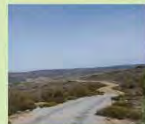
Senda de la Peña del Águila