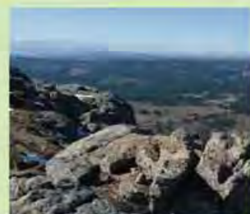
Vistas de la sierra de Gredos desde la Peña del Águila