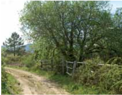
Camino con castaño