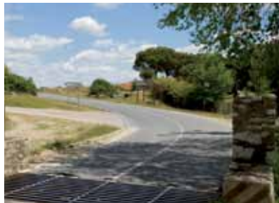
Inicio Tramo C

quedan muestras de lo que pudo ser el robledal, en donde el hacha no llegó a acabar con todos los ejemplares. Este tipo de roble es el melojo o rebollo, y su identificación no puede ser más sencilla, ya que sus hojas tienen