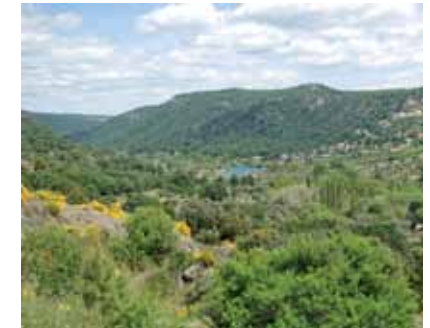
Valle del Arroyo de las Tortolas

El desnivel es acusado y se deberá bajar con cuidado, especialmente los ciclistas y los que utilicen el caballo para realizar la ruta. Entre pinos, y siempre bajando se llegará a una curva en la