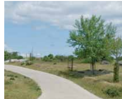
Tramo de la dehesa

unas hendiduras que casi llegan hasta el nervio central, son de color verde en el haz y cenicientas en el envés, y éste tiene una pelusilla que le da un tacto suave. Tienen la peculiaridad de ser marcescentes, es decir, se mantienen en el árbol una vez marchitas hasta que la hoja del año siguiente la empuja. Es un árbol capaz de brotar de raíz, por lo que a menudo forma rodales en los que se apelonan varios árboles juntos. Un poco más adelante podremos reponer fuerzas en el descansadero de La Dehesa. Seguimos el camino de tierra, de frente, hacia la urbanización Entrepinos, que como su nombre indica se encuentra ubicada en medio de un gran pinar. El camino principal continúa descendiendo hacia el valle, pero nosotros debemos desviarnos hacia la