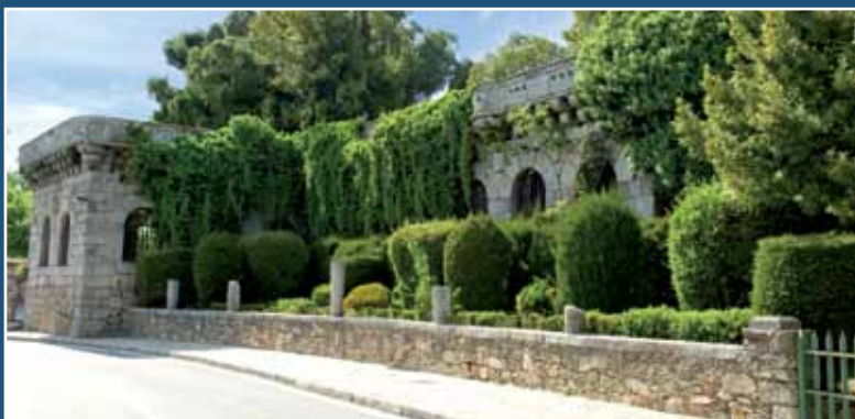
PALACIO DE VILLENA

Lo ordenó construir el condestable D. Álvaro de Luna, valido del rey D. Juan. Es de estilo románico y con arquería de medio punto. Sus jardines son de extraordinaria belleza, con sus recuadros de boj, arrayanes, altos cipreses, azufaitos, asientos de piedra cobijados por hornacinas en casetonas y un espléndido estanque, reconstruido recientemente, y que en su día sirvió de escenario para la celebración de espectáculos acuáticos, llegándose incluso a organizar batallas navales con barcos a escala. Cuenta la leyenda que el valido del rey, D. Álvaro de Luna, no llegó a ver el palacio construido, ya que, según parece, una adivina le vaticinó que moriría en cadalso, y D. Álvaro, al parecer un personaje muy supersticioso, no volvió a pisar nunca más las cercanías de Cadalso de los Vidrios. Finalmente la augur no se equivocó porque, D. Álvaro murió decapitado por orden del Rey en un cadalso, que eran los antiguos tablados que se erigían para la ejecución de los condenados a muerte.