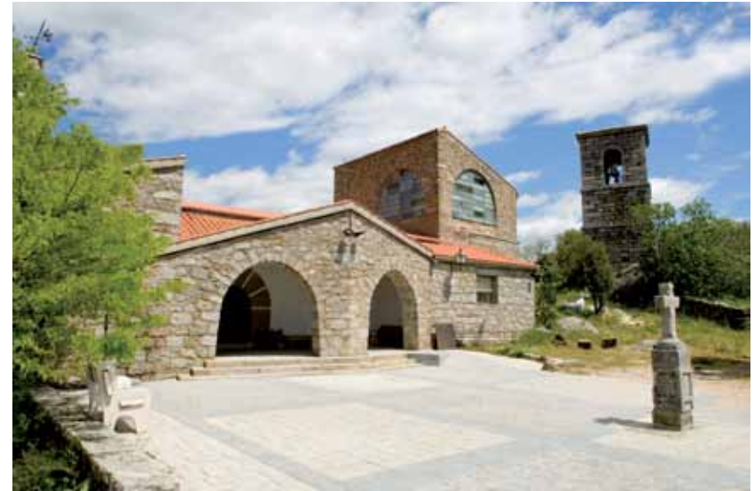
Iglesia de Rozas de Puerto del Real

Iniciamos una ruta de distancia media, la única Cañada Real que discurre por unos dieciséis kilómetros, que nos llevará por un castañar muy bien conservado, de hecho Rozas de Puerto