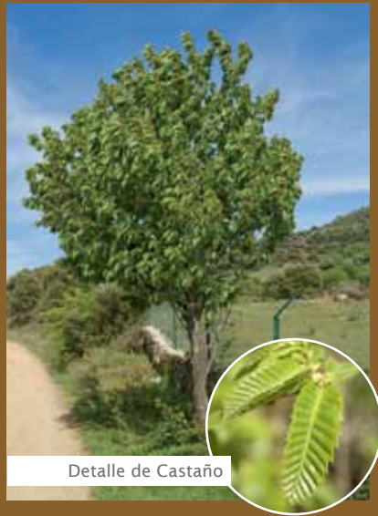
Detalle de Castaño

El fruto es la conocida castaña, que madura entre septiembre y noviembre, y hasta ese momento se protege dentro de unas cápsulas con forma de erizo, de color verde amarillento, de las que surgen entre uno y tres frutos.