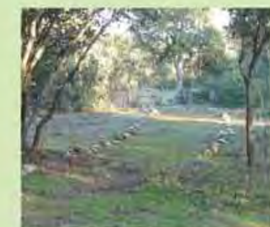
Camino por el interior de la dehesa