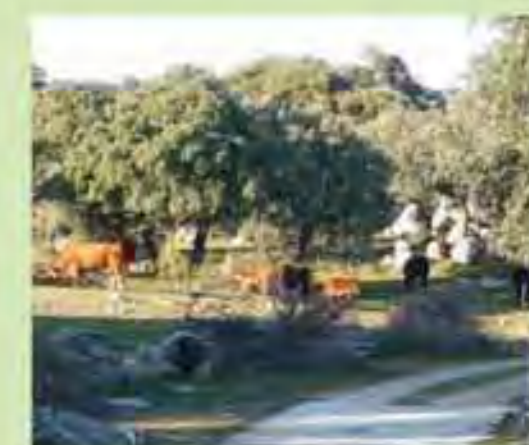
Camino de Navahonda