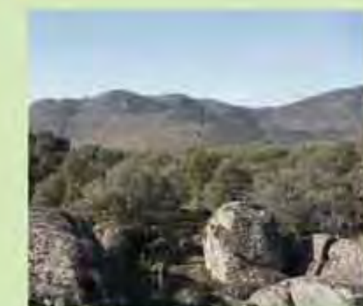
Vistas desde el fin de la senda

Plan de Dinamización del Producto Turístico de la Sierra Oeste de Madrid