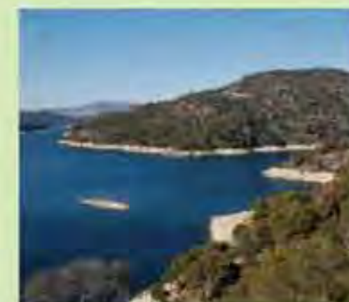
Embalse de San Juan

Plan de Dinamización del Producto Turístico de la Sierra Oeste de Madrid