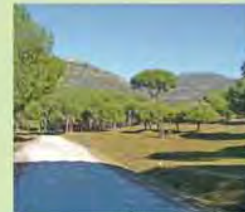
Senda del Yelmo