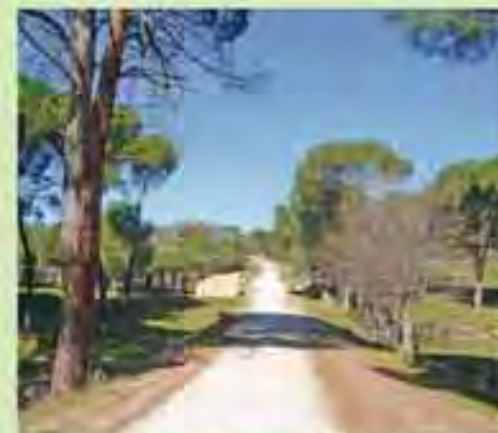
Tramo del embalse a Robledo de Chavela